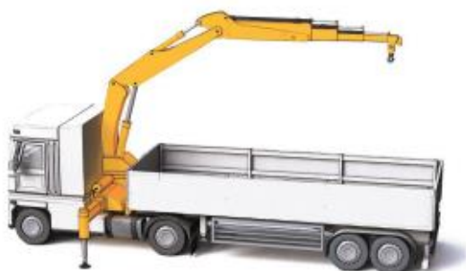
Grue de chargement montée derrière la cabine