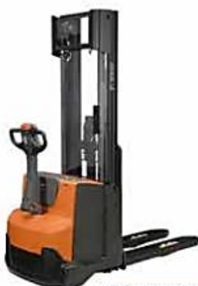
Mât télescopique double (ou triple)