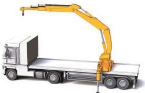
Grue de chargement montée en position centrale