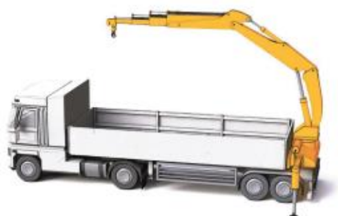
Grue de chargement montée en porte à faux arrière