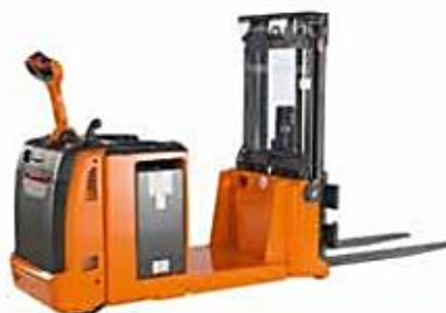
Gerbeur à contrepoids