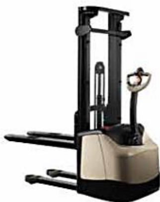
Bras de fourche recouvrants